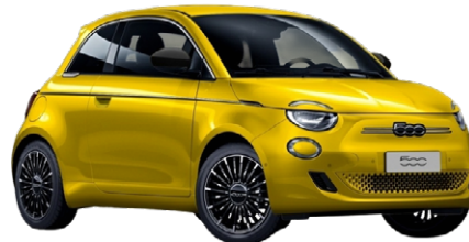
SUN OF ITALY